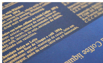
Exemple de haute résolution Impression or avec nyloflex® Gold A 116 D

plaques nyloflex® Seal F et nyloflex® Gold A couvrent tous les besoins et types de presses.